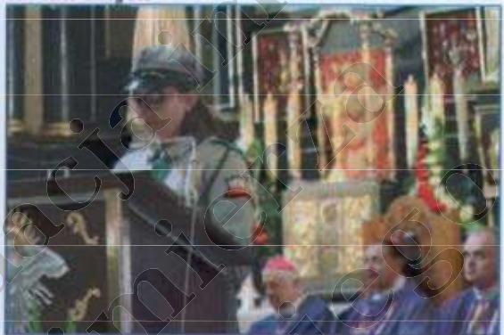
Niezwykłe poruszające przemówienie Wojewody Lubelskiego pana profesora Przemysława Czarnka