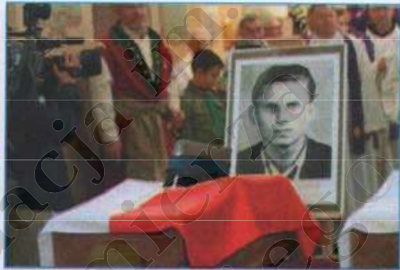
Plac przy krypcie Żołnierzy II Inspektoratu Zamojskiego Armii Krajowej