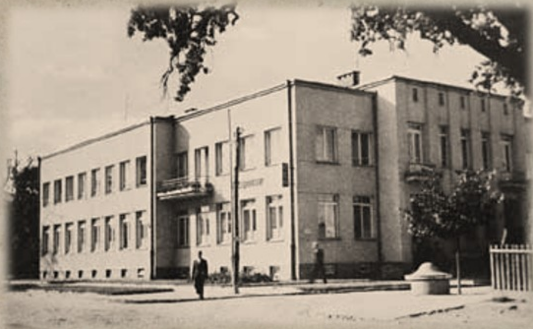
Komunalna Kasa Oszczędności. zdjęcie sprzed wojny