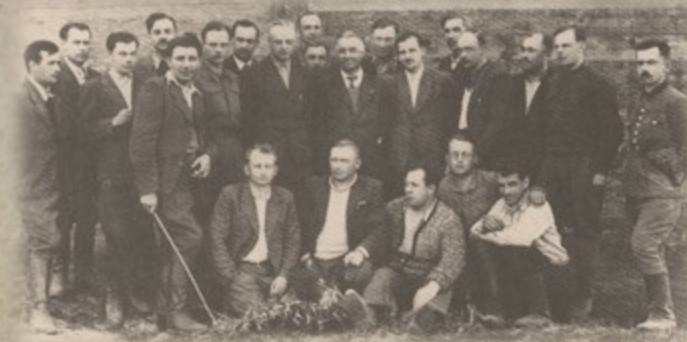
Odprawa oficerów AK w Nowokajetanówce (sierpień 1944)