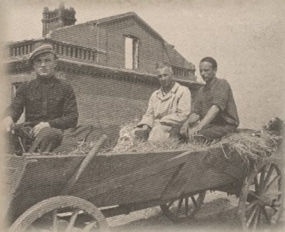
Komendant „Irka” i jego adiutant „Wyga” 1945 r.

Jesienią 1944 „Wyga” został mianowany oficerem do zadań specjalnych komendy obwodu AK, a następnie adiutantem komendanta obwodu.