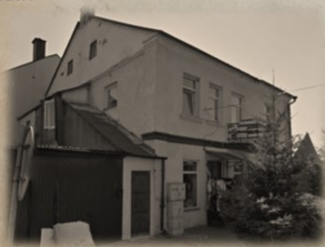
Wyrwany róg domu, stan współczesny

Widniała tam notka, że następną ofiarą będzie sam szef UB - Grodek.