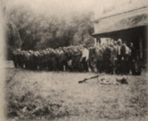
Kompania "Czarusia" batalionu "Wiktora" ("Luxa")

ocalenie życia. W czerwcu 1944 r. dowodził oddziałem AK, który z Puszczy Solskiej przywiózł broń ze zrzutu, przeznaczoną dla hrubieszowskich oddziałów AK przygotowujących się do realizacji Akcji „Burza”.