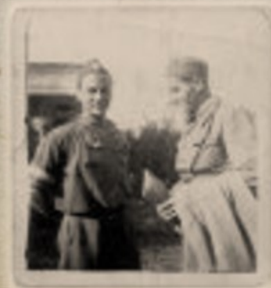
„Wyga” z „Czarusiem”

Poległ 6 kwietnia 1946 r. Do końca życia był wierny swoim ideologiom.